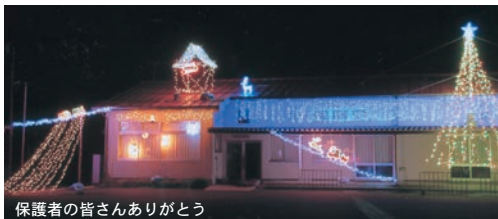
保護者の皆さんありがとう

今年を締めくくると相応しい行事内容だったと勝手に思い込み、一年を無事終えられた事に感謝です。